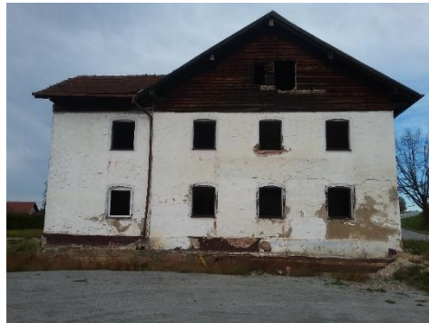
Ehem. Bergwirt, Aidenbacher Str. 9