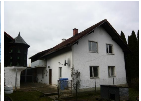
Pfarrkirchener Straße 39