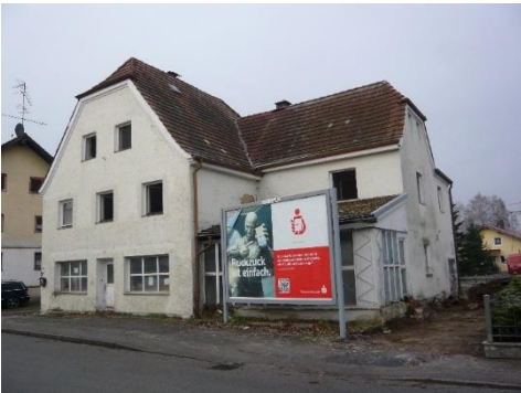
Ehem. Klimbim, Hauptstr. 8

Die Gemeinde hat verschiedene Anwesen im Ortsbereich Egglham sowie ein Anwesen in Oberegglham erworben. Diese Bauruinen wurden inzwischen beseitigt und über ein Dorferneuerungsverfahren sollen diese Flächen einer infrastrukturellen Nutzung zugeführt werden. Das Anwesen in der Pfarrkirchener Straße 39 wurde abgebrochen, um Immissionswerte für das angrenzende geplante Gewerbegebiet einhalten zu können.