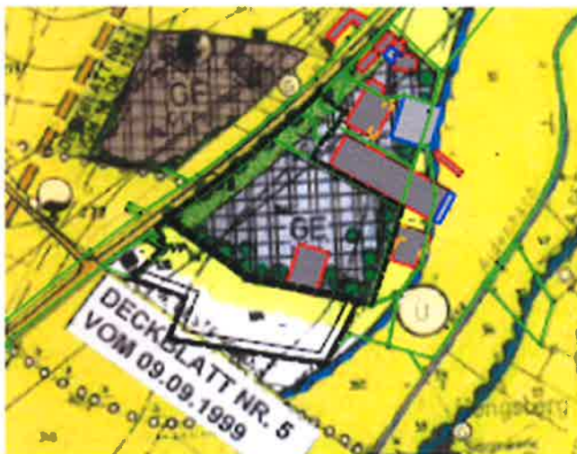
DARSTELLUNG VOR 15. ÄNDERUNG

Fl.Nr. 334; Fl.Nr.Till. 341 Gemarkung Eggldham; Gemeinde Eggldham