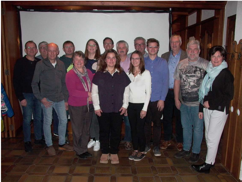
Bild: Gründungsteam des Dorfvereines Baumeister e.V.

Die Gemeinde hat das denkmalgeschützte Gasthaus „Baumeister“ mitsamt Nebengebäuden und dem umliegenden Gelände bereits 2019 erworben. Seitdem konnte jedoch kein geeigneter Pächter gefunden werden, abgesehen von einzelnen Sonderöffnungen durch den Gartenbauverein oder anderen örtlichen Vereinen, weitgehend geschlossen.