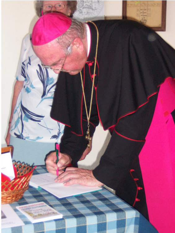
Bischof Schraml trägt sich ins Gästebuch ein