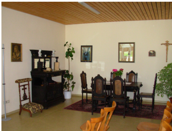
Zimmer von Peter Griesbacher

Mit einer Ausstellung und einem großen Fest wurde am 31.05./01.06.2008 der 75. Todestag des großen Sohnes der Gemeinde gedacht.