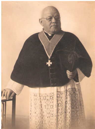
Regensburg, 9. April 1930

Im März 1930 wird er durch das Stiftskapitel von St. Johann zum Stiftsdekan gewählt.