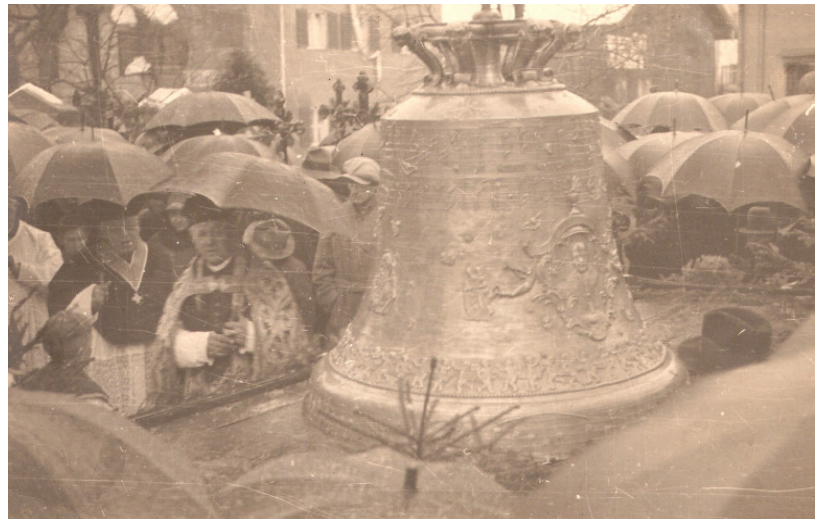
Glockenweihe in Egglham, Januar 1932